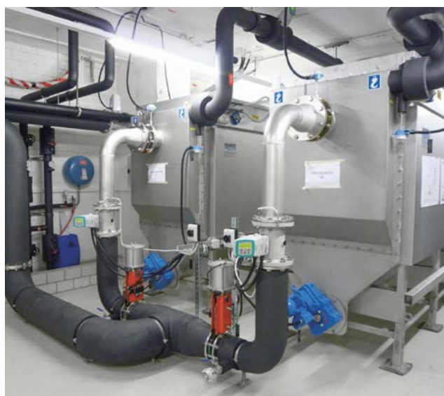
Wärmepumpen sind das Herzstück der Abwasserwärmenutzung; Wärmetauscher wie hier auf dem Foto rechts liefern die Wärme aus dem Abwasser