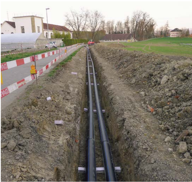
Mit dem neuen Programm kann die Förderberechtigung aufgrund der Wärmelieferung in Abhängigkeit der Trassenlänge einfach ermittelt werden